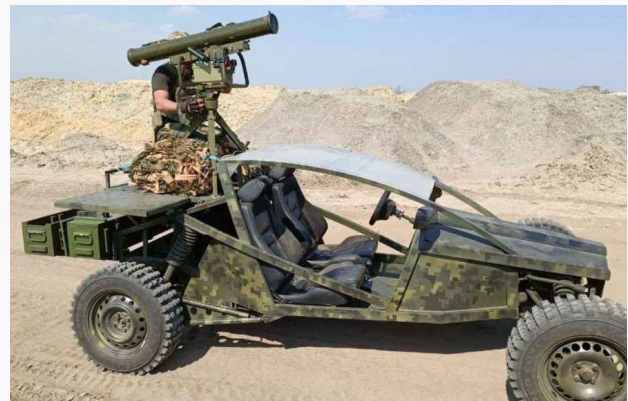
Vehículos modificados para el combate. Izquierda ISIS (Siria), derecha Ejército de Ucrania.

Pérez (2018) detalla como en abril del 2003, en el marco de la Operación Iraquí Freedom, Fuerzas Especiales (FFEE) de EE.UU. y fuerzas Kurdas se enfrentaron contra fuerzas mecanizadas iraquíes en el Paso de Debecka, entre las ciudades norteñas de Mosul y Kirkuk. Eran fuerzas ligeras que no contaban con vehículos blindados pesados, sólo con vehículos de reconocimiento con armas automáticas, pero con una buena cantidad de misiles antiblindaje Javelin;