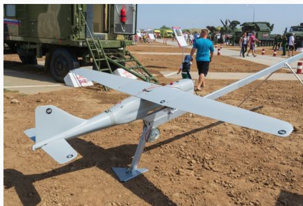
Izquierda: Vehículo Panhard VBL lanzamisiles AT diseñado de acuerdo a las premisas del Comandante Brossollet. Derecha: UAS Orlan-30 de reconocimiento y exploración.

El comando de misión se enfoca en los objetivos de una operación, no en cómo lograr-