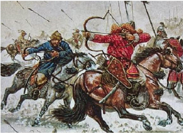
Jinetes Mongoles.

Kommandos podían agruparse a la orden de un líder y formar unidades de nivel Batallón y hasta Brigada, para derrotar a las fuerzas británicas de magnitud de escalón superior, para luego volver a desagruparse y continuar con su lucha de desgaste. El saber aprovechar la alta movilidad táctica de sus Kommandos montados, la flexibilidad, la iniciativa y la sorpresa, les permitieron a los colonos afrikáners causar graves pérdidas en hombres y material al Imperio Británico, sólo el bloqueo económico y una política de terror entre la población civil bóer, pudo doblegar a tan hábil y decidido ejército irregular. El hecho de que una fuerza de civiles armados hubiera resistido tanto tiempo a un ejército profesional permite deducir que la guerra pudo ganarse en el nivel táctico, pero esta debe estar acompañada de buenas decisiones al nivel estratégico.